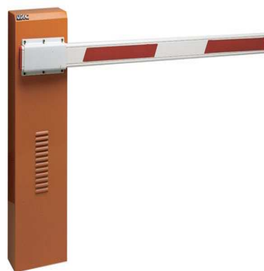
Szlaban hydrauliczny FAAC 640

Dzięki swemu smukłemu, eleganckiemu i solidnemu wyglądowi, szlabany FAAC serii 640 są idealnym rozwiązaniem dla tak prestiżowej imprezy i lokalizacji, jak właśnie Igrzyska Olimpijskie i sam Park Olimpijski. Szlabany serii 640 są ponadto dostępne w różnych wersjach wyposażenia, m.in. z zabezpieczeniem