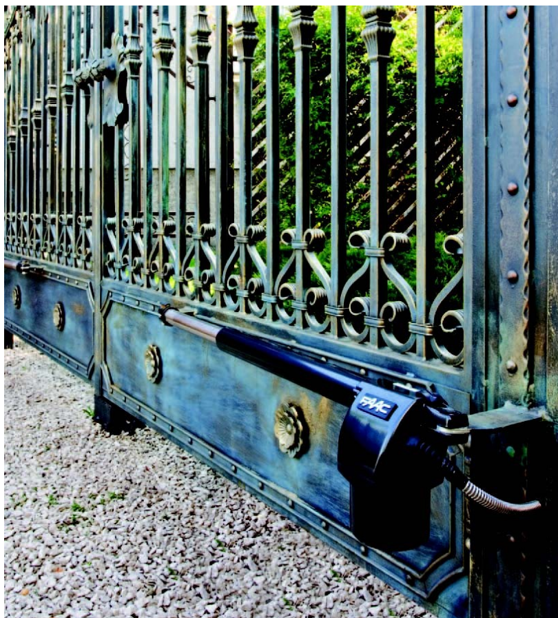
Napęd elektromechaniczny do bram skrzydłowych 414 Long FAAC

Warto to zrobić, również ze względu na fakt, że trudno jest samemu zorientować się, jakie najnowsze produkty oferują poszczególne firmy. – Zdarza się, że klient zmienia całą bramę, a przy pomocy profesjonalisty mógłby dopasować tylko odpowiedni napęd. Wychodząc na przeciw oczekiwaniom klientów, wprowadziliśmy na rynek napęd elektromechaniczny 414 Long,