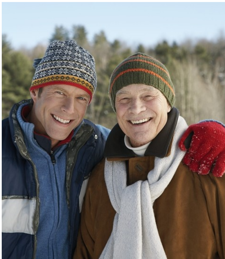
Prawdziwi mężczyźni też chorują, odczuwają ból gardła i męczący katar

Panuje powszechne przekonanie, że mężczyźni powinni być niezawodni. Prawdziwy superman nie choruje, a jeśli już mu się zdarzy, to stara się zachować pozory zdrowia. Niestety takie podejście może doprowadzić do poważniejszej choroby i powikłań. Szczególnie dolegliwości gór-